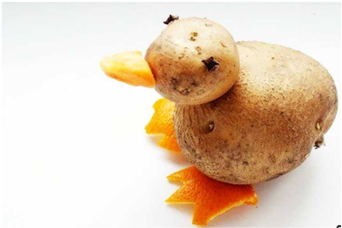
А также уточки из кабачка...