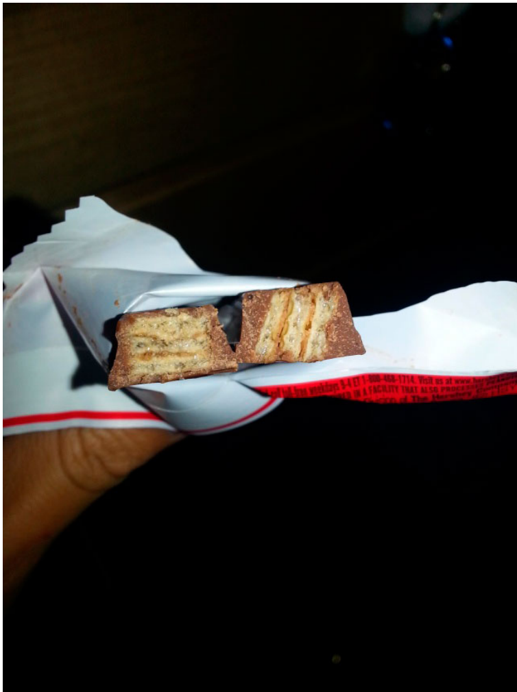
Батон, при выпечки которого попал кусочек ржаного хлеба: