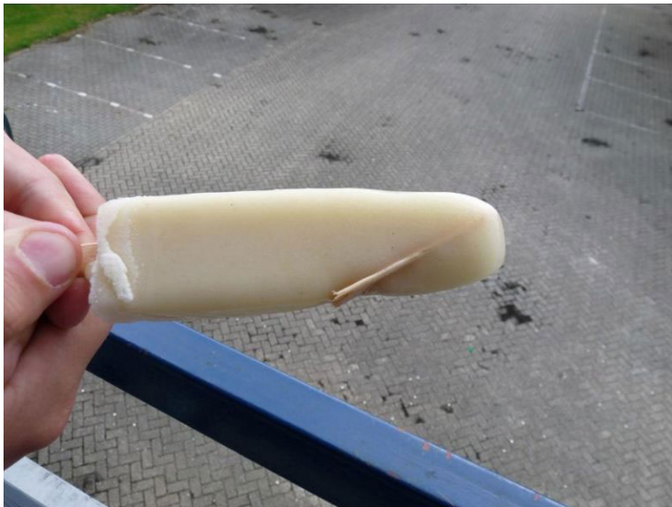
Мороженое - вафельная трубочка без вафли: